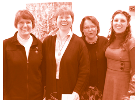
Mitarbeiterinnen SOLWODI Osnabrück