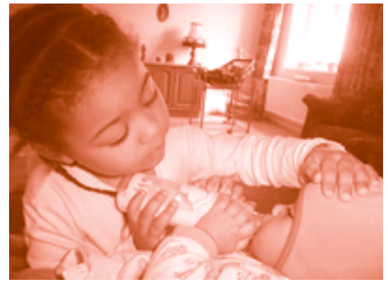
Kinder in einer SOLWODI-Schutzwohnung

Ein Kind wird in einem Stall geboren, weil in der Herberge kein Platz ist. Kurz darauf müssen seine Eltern mit ihm in ein fremdes Land fliehen. Es ist von den Weihnachtsgeschichten im Neuen Testament bei den Evangelisten Lukas und Matthäus die Rede – von Armut, Flucht und Heimatlosigkeit. Solche Geschichten erzählen auch Frauen im Abschiebegefängnis Berlin-Köpenick. Mitarbeiterinnen der Berliner SOLWODI-Beratungsstelle, die Ausländerinnen in Abschiebehaft betreuen, haben drei typische Geschichten für diesen Rundbrief aufgeschrieben, um an Jesu Geburt zu erinnern. Jesus hat sich mit seinem Eintritt in diese Welt mit den Ärmsten solidarisiert. Für alle, die in seiner Nachfolge stehen, sich Christen oder Christinnen nennen, heißt das, keinen Menschen in Not allein zu lassen.